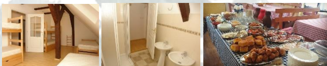
Prostor Ekološkog centra „Radulovački“

Sremski Karlovci su malo mesto u kojem svaka zgrada, kuća i ulica priča neku slavnu priču i koje posebno krase Magistrat, Saborna crkva, Bogoslovljia, Patrijaršijski dvor, Karlovačka gimnazija, Dvorska bašta i Stražilovo. Ekološki centar „Radulovački“ predstavlja jedinstven prostor specifično opremljen i namenjen za smeštaj i edukaciju dece, mladih i svih građana i iz tog razloga je naš izbor za održavanje zimske škole. Individualna nastava sa učenicima, zajedničko muziciranje u okviru kamernih sastava, ekološke radionice, muzička druženja i završni koncert su aktivnosti u okviru zimske škole.